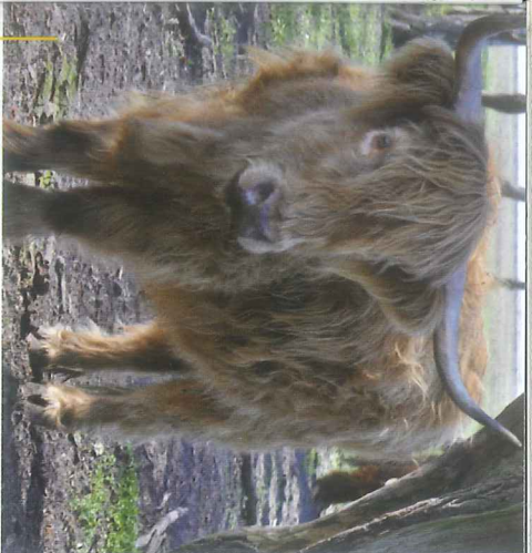
Jedną z atrakcji jest możliwość obserwacji koników polskich i krów rasy scottish highland (na zdjęciu) żyjących w naturalnym środowisku.