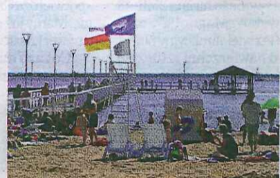
Plaża z Błękitną Flagą w Stepnicy

Pracujecie właśnie nad budżetem 2014. Na jakie inwestycje będziecie kłaść nacisk w przyszłym roku?