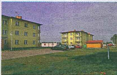
Bloki mieszkalne wielorodzinne w miejscowości Łąka

wie 4 tysiące ha wód, lasów i łąk, na których pasą się stada dziko żyjących koni-ków polskich.