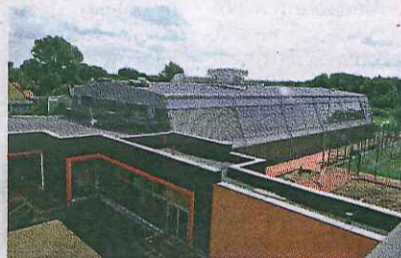
Hala widowiskowo-sportowa w Stepnicy

Gmina intensywnie inwestuje w infrastrukturę drogową. Od Bogusławia do Stepnicy (port) na byłym torowisku powstaje nowa droga. Ponad 1,5 km nowej nawierzchni ma być wykonane do połowy listopada, koszt tej inwestycji to ponad 3 mln zł. Dodatkowo gmina zbudowała za blisko 5 mln zł halę widowiskowo-sportową w Stepnicy, z widownią dla 170 osób. Druga hala za ponad 2 mln zł powstanie w przyszłym roku przy Szkole Podstawowej w Racimierzu.